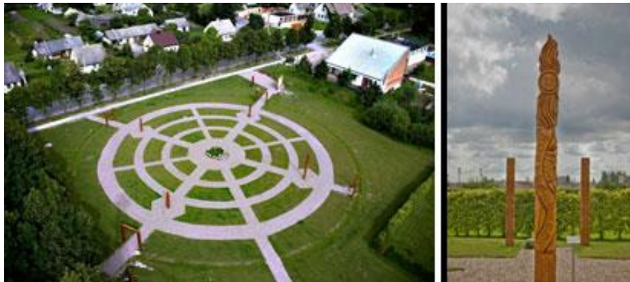
Baltu dievību dārzs Naisiu pilsētā

Lai vairāk uzzinātu par Lietuvu, lietuviešu draugi mūs iepazīstināja arī ar savu skolu, skolas etnogrāfisko un skolas vēstures muzeju. Devāmies ekskursijā pa Meškuičiem, priecājāmies par jauki iekārtoto parku. Kopā ar lietuviešu draugiem pabijām Naisiu pilsētiņā, kur apmeklējām baltu dievību muzeju, uzzinājām, ka ļoti daudzas dievības gan mums, gan lietuviešiem ir kopīgas. Pabijām arī Šauļos, kur apskatījām pilsētu, tās arhitektūru un ievērojamākās vietas.